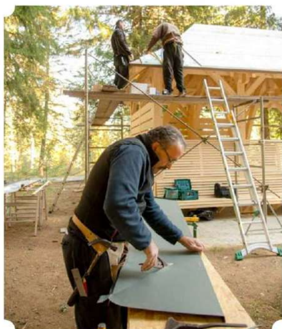
↑ Construction du Habert de la prairie du Col de Porte : DNF Forêt d'Exception